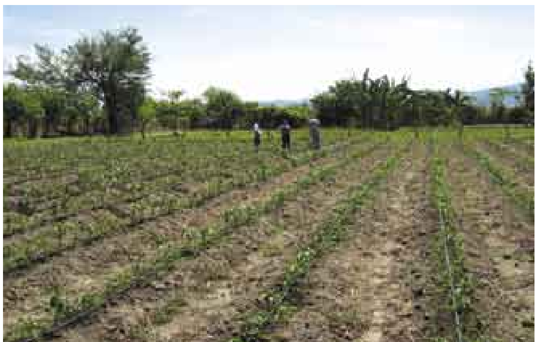
Irrigation au goutte-à-goutte en Amérique centrale

Le Team fonctionne comme référent pour les questions thématiques liées au domaine de l'eau. Il est responsable de la coordination avec les autres offices fédéraux ainsi que des positions adoptées par la DDC lors de dialogues multilatéraux dans le cadre du Comité Interdépartemental pour le Développement Durable (CIDD) en matière d'eau. Il est également responsable du conseil et soutien techniques aux programmes et aux partenaires. De plus, le Team assume la responsabilité de la mise en réseau institutionnelle ainsi que de l'apprentissage institutionnel dans le domaine de l'eau et du développement.